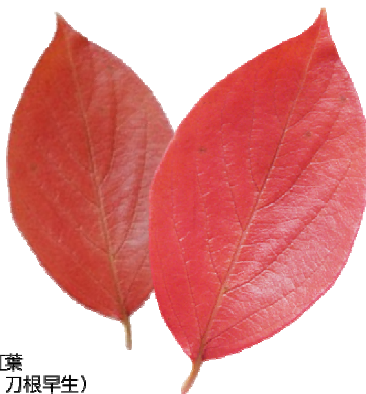
保存柿紅葉 （品種：刀根早生）